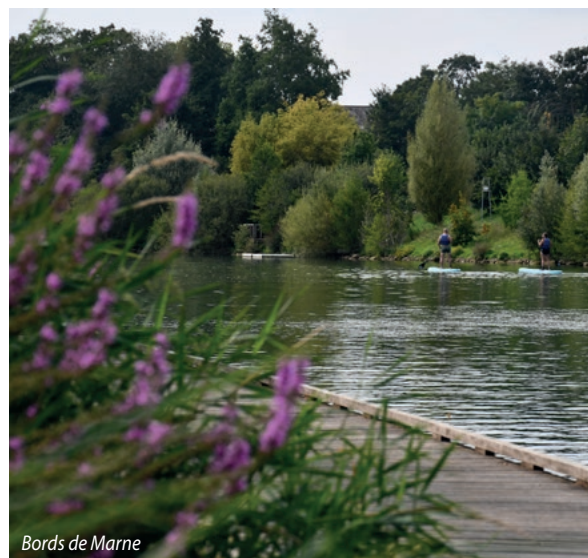
Bords de Marne

Et de conclure : « nous ne sommes pas sur un territoire rural, nous vivons à proximité de Paris et il m'arrive pourtant de croiser une horde de chevreuils évoluant librement. J'aime ce territoire parce qu'il offre ce très bel équilibre ».