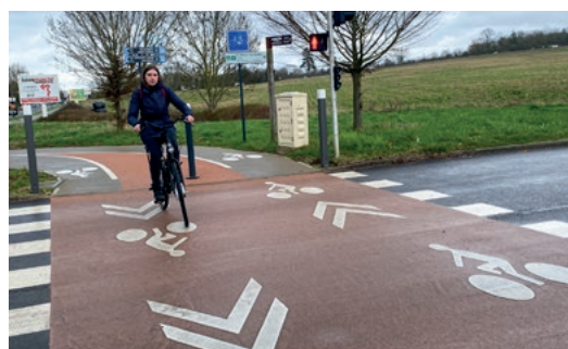
La ligne V4 du réseau Vélo Île-de-France relie Vaires à Val d'Europe.

qu'il a, à la fois en interne avec les services juridique, comptabilité, RH ou encore la direction générale, et en externe avec tous les partenaires : les communes, la Région, le Département, Île-de-France Mobilités... « C'est intéressant de prendre conscience des différents points de vue. L'objectif est de faire se rejoindre plusieurs intérêts en répondant aux exigences des cahiers des charges établis. Il n'y a pas de monotonie » résume-t-il.