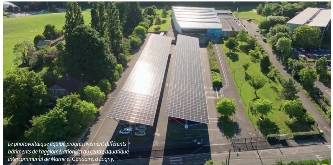
Le photovoltaïque équipe progressivement différents bâtiments de l'agglomération, ici au centre aquatique intercommunal de Marne et Gondoire, à Lagny.

« J'aime le côté touche-à-tout du métier. L'alternance entre le bureau et la partie chantier sur le terrain me convient parfaitement » confie d'emblée le jeune