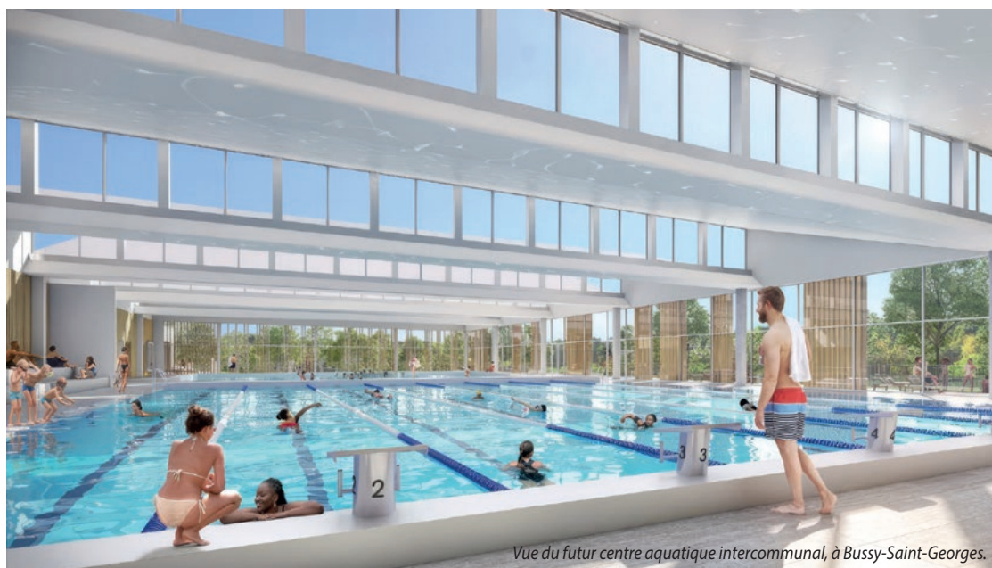
Vue du futur centre aquatique intercommunal, à Bussy-Saint-Georges.

Il s'agit d'un pôle d'expertise commun qui a été créé au niveau de l'agglomération et qui œuvre au service des communes de l'intercommunalité. Le service de la Commande publique est un service commun et est ouvert à toutes les communes du territoire qui souhaitent y adhérer pour passer leurs marchés publics. Aujourd'hui, 17 communes sur 20 ont mutualisé ce service.