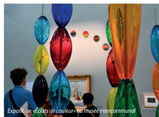
Exposition «Éclats de couleur» au musée intercommunal

Dans chaque bibliothèque, scannez votre carte et retirez ou déposez 2 ou 3 documents sur le plateau qui détectera automatiquement les ouvrages via leur puce.