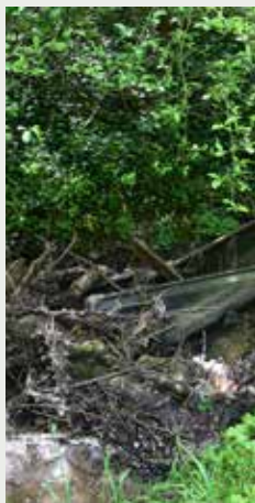
Ru du Bouillon