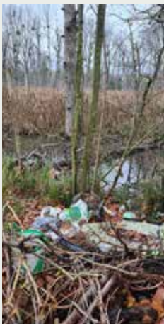
Ru de la Gondoire