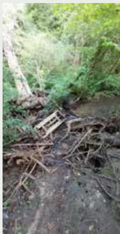
Ru de la Brosse

Ainsi, l'arrêté préfectoral n°2024/DDT/SEPR-196 du 10 octobre 2024 autorise Marne et Gondoire, pour une durée de 5 ans, à effectuer les interventions d'entretien sur du domaine privé, afin de restaurer le libre écoulement des eaux, instaurer une gestion cohérente sur l'ensemble de la rivière, diversifier les habitats naturels et atteindre un bon niveau de qualité des eaux.