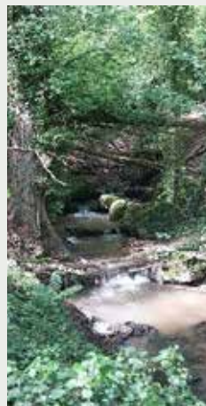
Ru du Bicheret