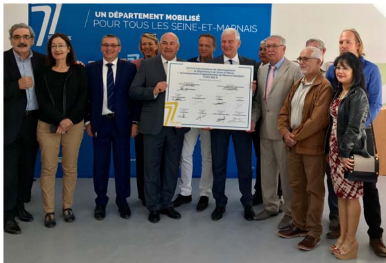
Le CID a été signé le 12 juin 2017 dans les locaux du Département

Un soutien financier de poids en faveur de l'éducation, du sport, des déplacements, de la santé et de la sécurité.