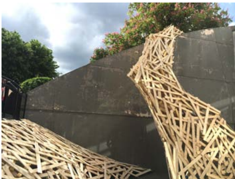
La culture investit le centre-ville

De mercredi à samedi matin, redécouvrez le centre-ville de Thorigny avec des concerts, brocante des enfants, expositions, troc, repas guinguette, lectures déambulatoires, marché de la fête des mères puis samedi, rendez-vous à la grande prairie pour un festival d'arts en tout genre et un barbecue avant le pique-nique du dimanche ! Tout cela, c'est déjà bien, mais le sel de ce festival, c'est que ces animations comporteront toutes une originalité qui leur conférera un caractère insolite, à commencer par les lieux, souvent des endroits «cachés» du centre-ville. À voir, le pingpongscreen dans la salle sous le belvédère. Vernissage le vendredi 26 mai à partir de 17 h 30.