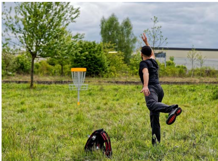
Précision et élégance, le geste parfait ! Étang de la Broce (Bussy-Saint-Georges) samedi dernier