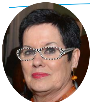
Mireille Munch maire de Ferrières-en-Brie