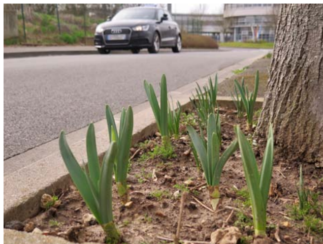
Narcisses en pourtour d'arbre à Lagny

Les élus ou agents de Bussy-Saint-Georges, Chanteloup, Dampmart, Lagny, Lesches, Montévrain, Guermantes, Thorigny et du Département participaient à cette réunion organisée par la direction de l'environnement de Marne et Gondoire.