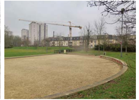
Terrain cédé par Marne et Gondoire