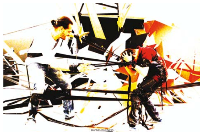
Impermanences par Lek et Romi (résidence 2013)

Le Parc culturel accueille des artistes en résidence dans les domaines des arts visuels, théâtre, danse et musique. Les projets sont présentés aux scolaires, au grand public et participent de la politique de la ville. Le Bureau autorise le président à solliciter des soutiens publics ou privés pour cette action.