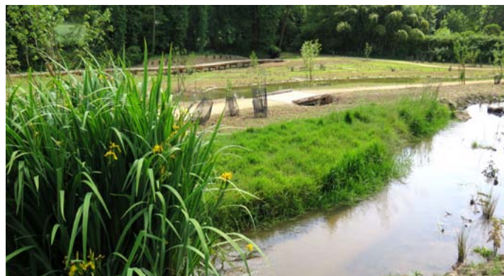
Bienvenue en zone humide