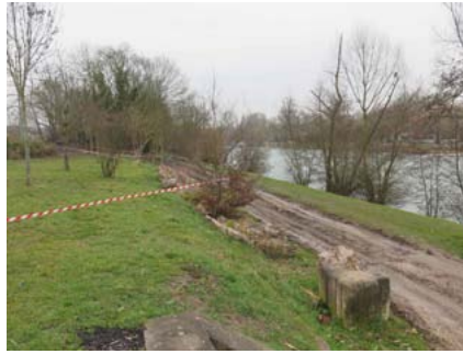
Terrain acquis par Marne et Gondoire

Acquisition d'un terrain de la commune de Thorigny nécessaire au projet intercommunal d'aménagement. Cession à la commune d'un terrain contigu, ne faisant pas partie du périmètre du projet.