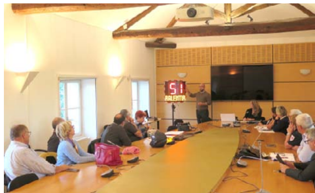
Rentilly mardi dernier

La communauté d'agglomération va acquérir 5 radars pédagogiques mobiles qui pourront être déployés à la demande des communes pour des opérations de sensibilisation. Le modèle retenu, présenté aux élus mardi dernier, se fixe et s'alimente sur l'éclairage public. Le radar est connecté à un écran qui au passage des véhicules affiche la vitesse et éventuellement un message. L'appareil enregistre aussi toutes les données, permettant de dresser des statistiques. Une initiative menée dans le cadre de la mutualisation et de la stratégie intercommunale de sécurité et de prévention de la délinquance.