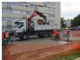
Orly Parc ce matin