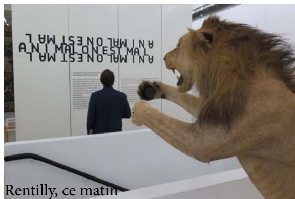
Rentilly, ce matin Le titre de l'exposition ? «Animal on est mal».