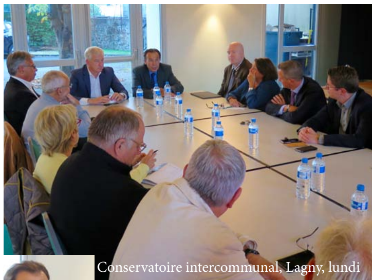
Conservatoire intercommunal, Lagny, lundi