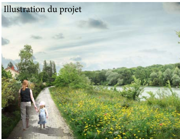
Illustration du projet