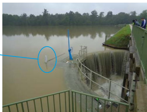
Le pic de crue a eu lieu mardi