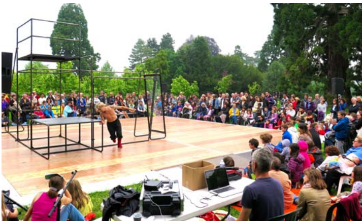
FLAG (Compagnie Yann Lheureux)