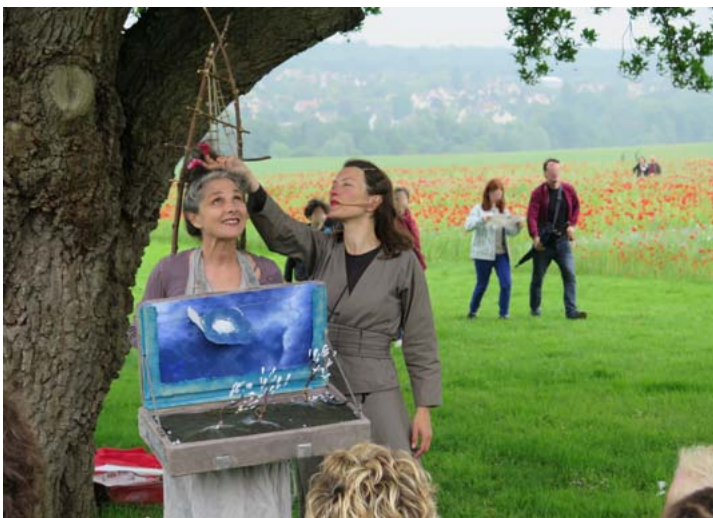
Les passantes (Vent viv)