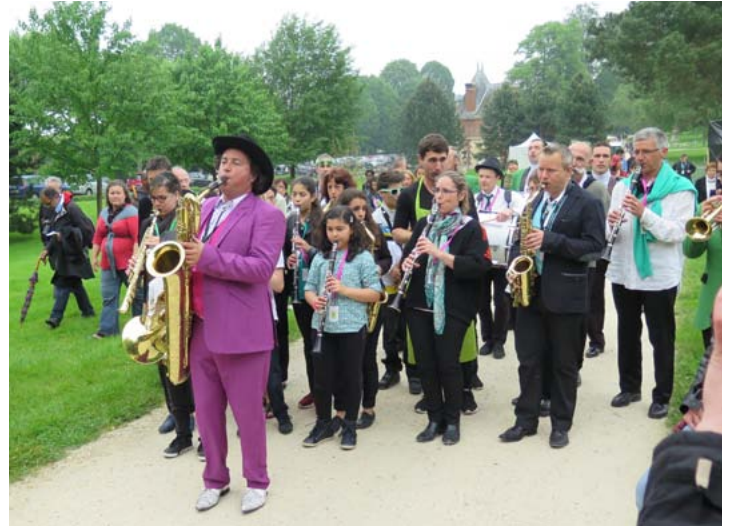
Green oignons (Brouhaha productions)