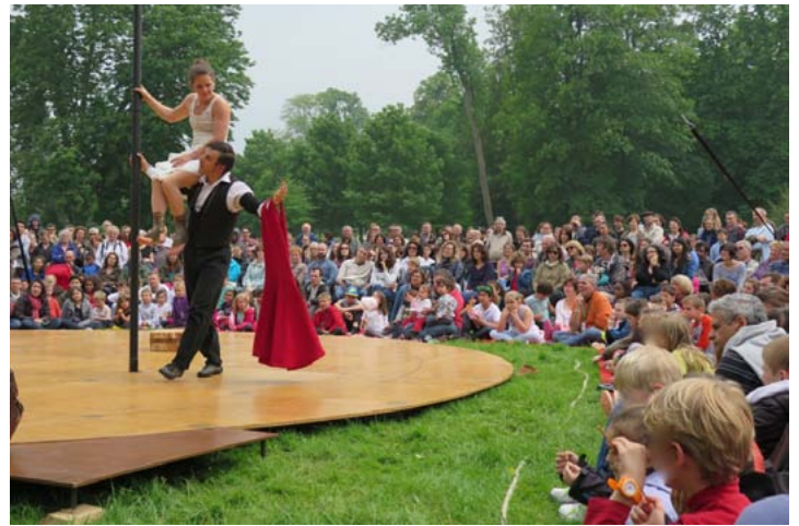
Green oignons (Brouhaha productions)