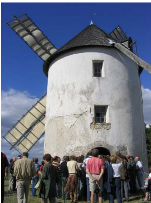
Le moulin de Belle-Assise à Jossigny