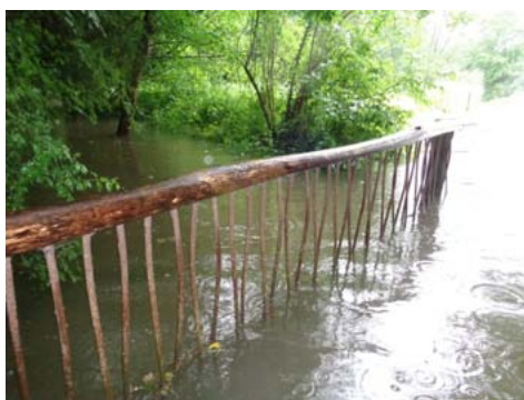
Passerelle piétonne lundi dernier