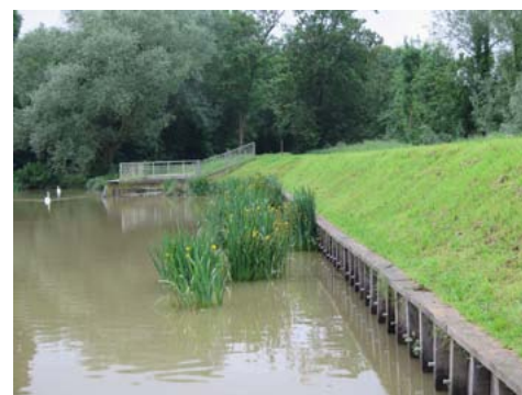
L'étang vendredi matin : retour à la normale