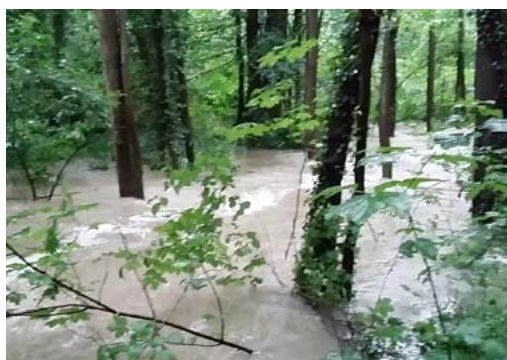
La Brosse en aval des déversoirs de l'étang mardi