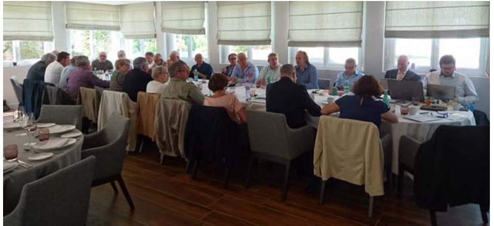
C'est au restaurant Le Quincangrogne à Dampmart que les maires et membres du bureau se sont retrouvés