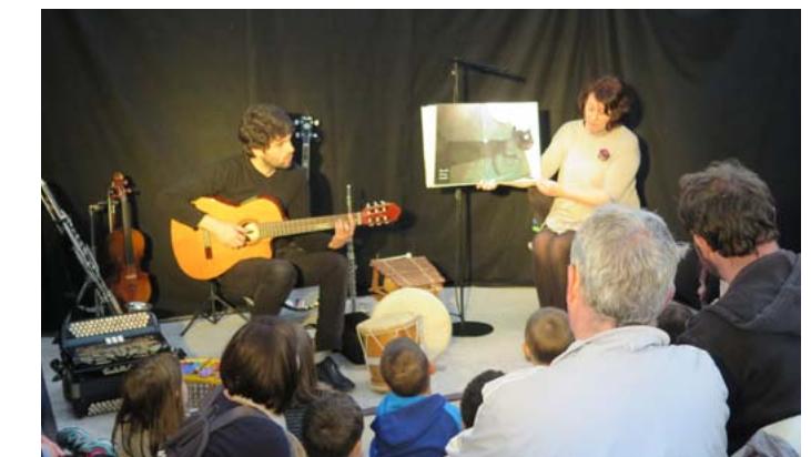
Buissemments d'images (Le souffle des livres)