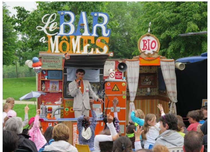
Le Bar à mômes