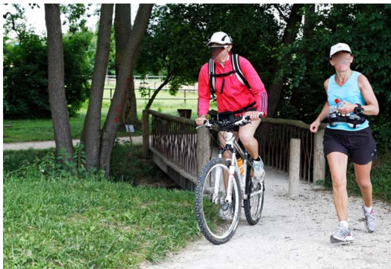
Promeneurs sportifs dans la vallée de la Gondoire, à Conches.

Quatre sites proposeront prochainement des vélos pour adultes et enfants que le public pourra emprunter pour une journée maximum contre une pièce d'identité : le moulin Russon à Bussy-Saint-Georges, le centre aquatique et les bords de Marne à Lagny et le parc de Rentilly.