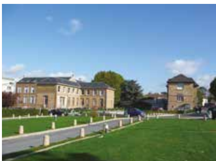
Les meulières de Saint-Jean et Colonel Durand.

Le parti pris architectural du projet reposait sur trois principes. Tout d'abord, reconverter les bâtiments dotés de qualités architecturales intéressantes, parce qu'ils sont témoins de différentes époques. Ensuite, prendre appui sur ce patrimoine pour établir de nouvelles constructions et, enfin, détruire les bâtiments peu adaptables, trop massifs ou mal situés. « Nous avons choisi d'avoir une transversale