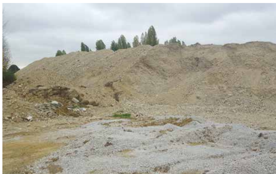
La butte du béton récupéré des démolitions.

C'est le volume de béton concassé issu des démolitions qui sera réutilisé pour la réalisation des nouvelles voiries.