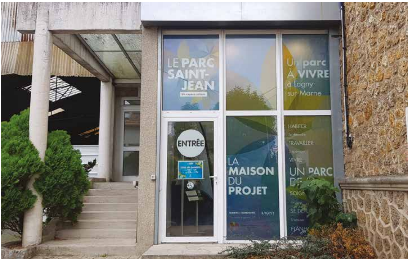
Entrée de la Maison du projet au 45, avenue du Général Leclerc, ouverte tous les samedis de 9h à 12h et de 14h à 17h.

« Animer les permanences de la maison du projet est pour moi une expérience très enrichissante. Au cœur de la concertation, j'ai pu appréhender la vision des différents acteurs impliqués dans ce projet, qui va dynamiser la ville où j'habite. J'ai commencé par bien l'étudier, pour mieux répondre aux questions que l'on allait me poser. Parmi les visiteurs, il y a des riverains, des acheteurs potentiels, mais aussi quelques nostalgiques de l'ancien hôpital. »