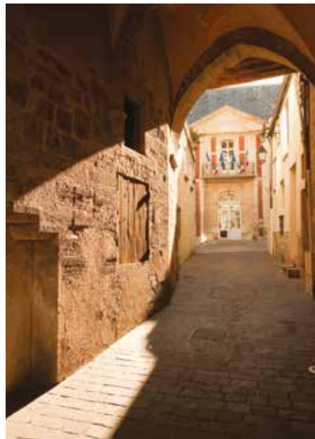
Lagny, est riche d'une grande diversité architecturale acquise au cours des siècles.

Quid de la hauteur des constructions ? « Dans l'Oise, nous avons l'habitude de travailler dans des secteurs ruraux ou périurbains. Pour nous, ici, plusieurs options