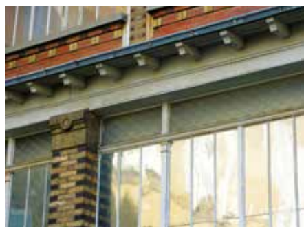
Éléments de façade du bâtiment Saint-Jean.

ment pour personnes âgées dépendantes (Ehpad). « Notre idée était de concevoir le bon projet pour le bon site, en accordant une importance au déjà là, plutôt que de tout raser. Nous avons voulu poser un regard bienveillant sur cette opération, afin de pouvoir transformer ce site hospitalier