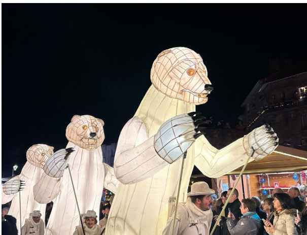
Ville de Thorigny-sur-Marne