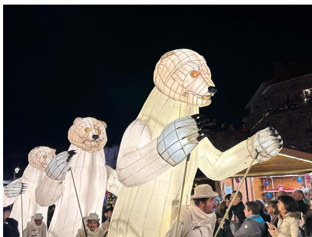
Ville de Thorigny-sur-Marne