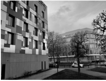
Montévrain , en bordure du Val d'Europe Yves Bouquet