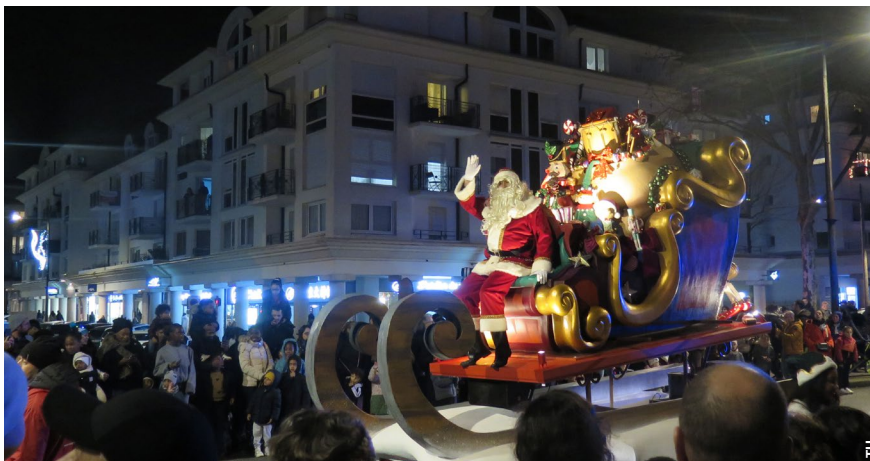
Bussy-Saint-Georges, lors de la parade de Noël le 19 décembre