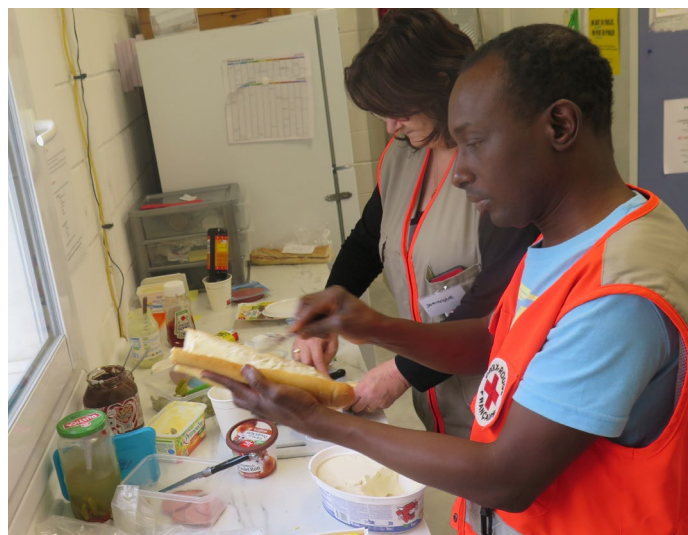
LA CROIX ROUGE CERCHE DES BÉNÉVOLES