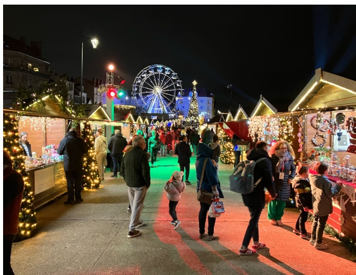
LE MARCHÉ DE NOËL DE MARNE ET GONDOIRE