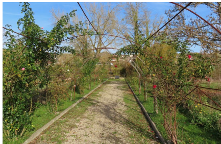
Montévrain , en bord de la Marne Yves Bouquet