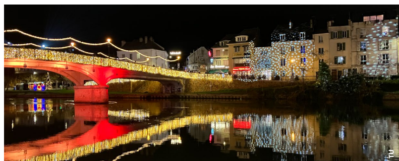
Thorigny-sur-Marne, lors du marché de Noël de Marne et Gondoire