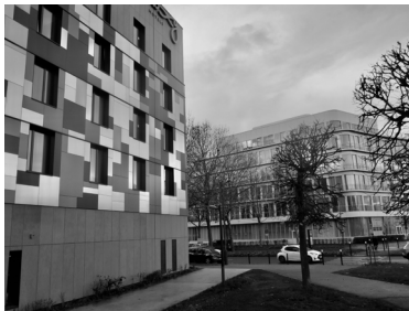
Montévrain , en bordure du Val d'Europe Yves Bouquet