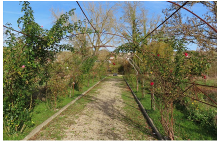
Montévrain , en bord de la Marne Yves Bouquet