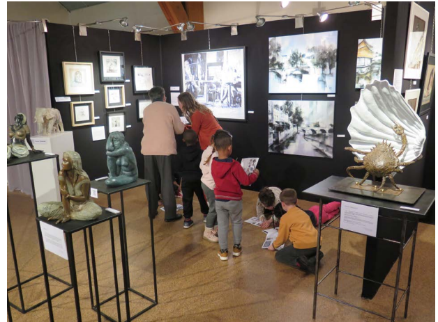
Visite de l'exposition pour les élèves. Au fond, les tableaux de Sergo

Les genres artistiques représentés rejoignent la sensibilité de Carmen Juárez Medina, dont la peinture est «figurative et imaginaire», selon ses mots. Mais il ne s'agit pas d'un parti-pris, assure la présidente : «notre seul critère est la qualité, qui aujourd'hui se trouve davantage dans les œuvres figuratives qu'abstraites.» Des séances de modelage et peinture pour les élèves ont conclu le salon. Un concours de dessin a également été organisé pour tous les enfants de la commune sur le thème du Mexique. «Faire rayonner la culture est naturel en tant qu'association locale», estime la présidente. Une initiative locale et internationale à la fois !