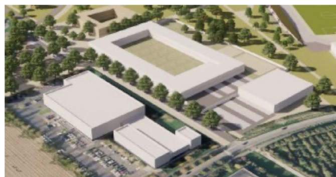
Projet de la Région

lycée de Thorigny-sur-Marne, en plus de la transformation de 400 places de la filière professionnelle en filière générale déjà envisagée en son sein», se fondant sur le constat que «de Meaux à Champs-sur-Marne, la population lycéenne ne cesse de progresser entraînant une saturation de l'ensemble des lycées publics locaux». Le nouveau lycée Samuel Paty à Montévrain et la transformation du lycée Auguste Perdonnet en lycée mixte professionnel et général font partie des mesures prises pour y remédier.