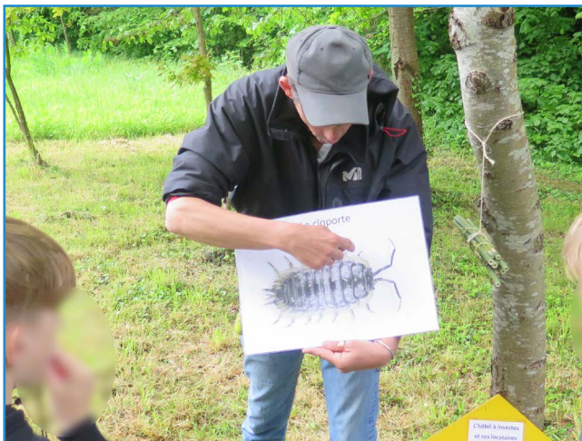
Marne et Gondoire fait l'école buissonnière