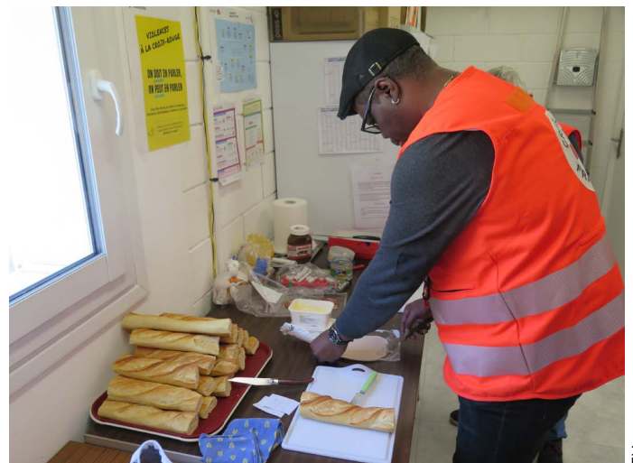
Un bénévole prépare des sandwiches