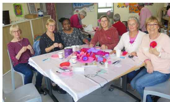
Octobre rose au centre social Mix'City le 20 octobre dernier

Orly parc fait ainsi figure de réceptacle