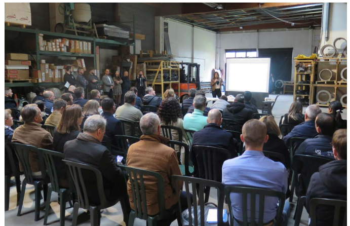
La réunion avait lieu dans les locaux de la société SPCC à Collégien qui s'apprête à passer au photovoltaïque.

C'est là que pour quelques curieux, un installateur de Coulommiers sort de son coffre sa botte secrète, adoptée par les concessions automobiles Riester dans le département : le panneau solaire flexible. Les 2 mètres