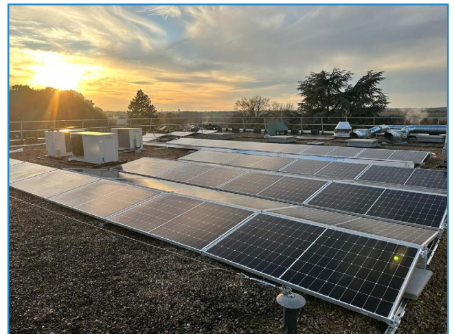
Prendre le soleil en terrasse plus qu'une invitation