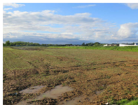
La parcelle du futur lycée