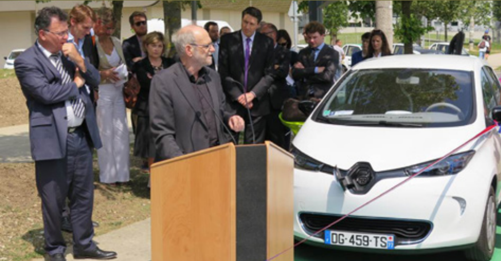
26 juin 2014 : inauguration des premières stations d'autopartage