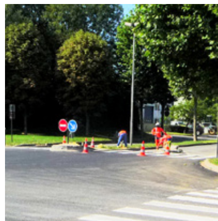
ZAE des Portes de la forêt