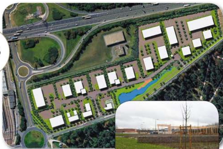
Vue schématique de la future ZAE du Gué Langlois

Aux abords du Parc culturel de Rentilly, la zone d'activité économique du Gué Langlois se dessine et l'ossature des entreprises se profile. On distingue aujourd'hui très nettement cinq bâtiments en chantier. Actuellement 6 signatures de vente sont actées et 3 promesses en cours. L'arrivée des premières entreprises se profile pour fin janvier 2009, les autres étant prévues pour le printemps. 55% de cette ZAE sont à ce jour commercialisés. Les autres ZAE ne sont pas en reste. La Communauté d'Agglomération de