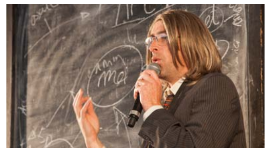
Les «Clowns d'affaire», c'est du sérieux (mercredi à Carnetin)