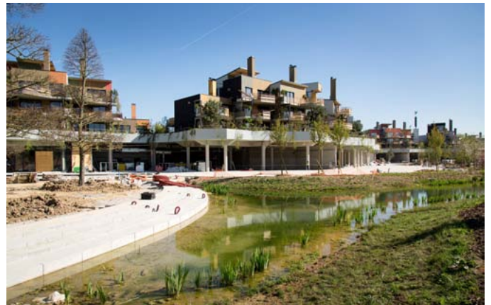
Promenade du lac (idem)