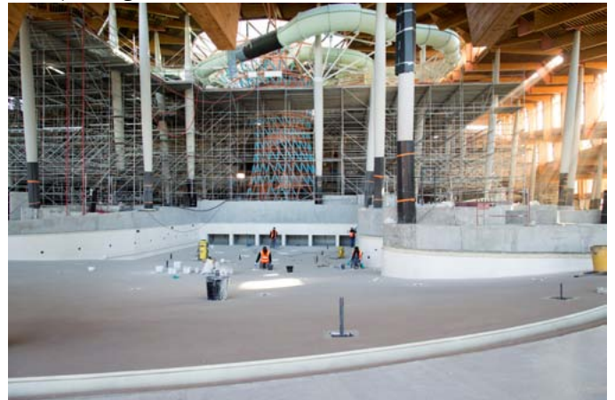
Ne pas oublier de remplir d'eau