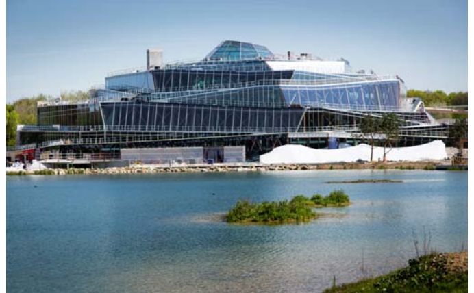
L'Aqualagon, un bel édifice

L'état de réalisation en images à la mi-avril