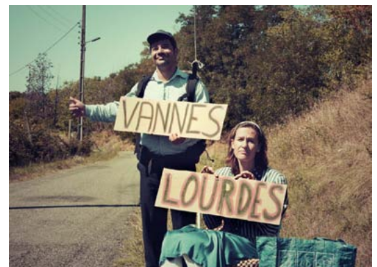
Humour subtil en perspective

Programme complet sur www.marneetgondoire.fr