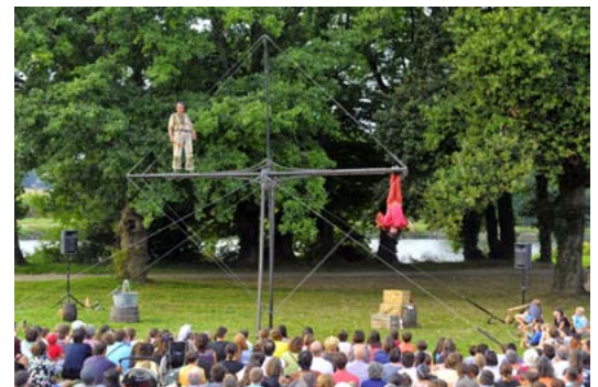
Vous pourrez assister à cette parade amoureuse le week-end (20 et 21 mai)