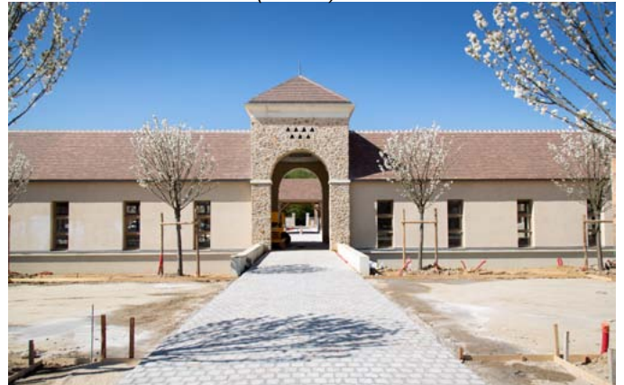
Entrée de la Ferme Belle vie