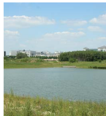
Bassin de retenue d'eaux pluviales