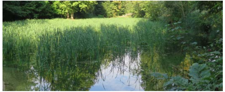
Surprise ! Le curage a libéré des graines d'hélophytes

Le Parc des Cèdre joue un rôle majeur pour la biodiversité, abritant 18 espèces d'oiseaux et offrant des habitats très variés pour la faune. En 2016, Marne et Gondoire a procédé au curage des bassins qui s'envasaient (avec traitement sur place des sédiments extraits) puis fait réaliser un diagnostic et un avant-projet pour des travaux de restauration. Des demandes de subventions vont maintenant être faites. Les travaux pourraient être engagés en juin 2017 pour 6 mois. Le projet prévoit entre autres une cascade pour relier les deux plans d'eau.