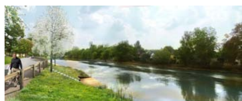
Ponton de pêche