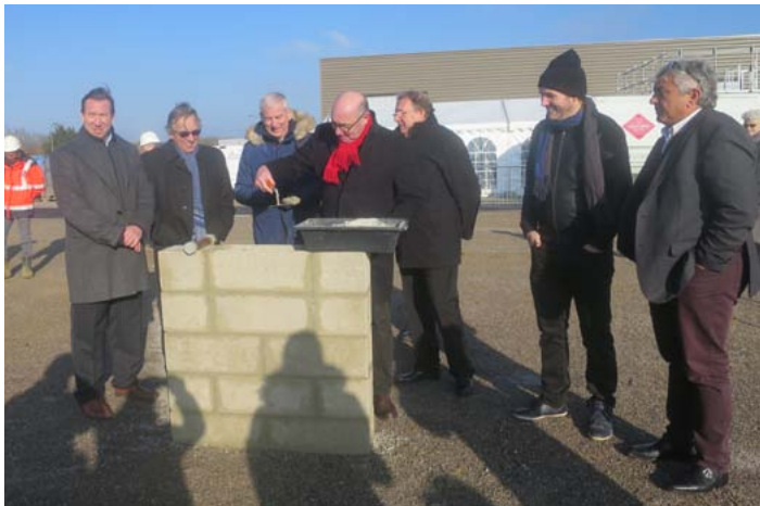
ZAE des Vallières à Thorigny mardi dernier

Le supermarché et sa galerie commerciale sont en cours de travaux et ouvriront début 2018.