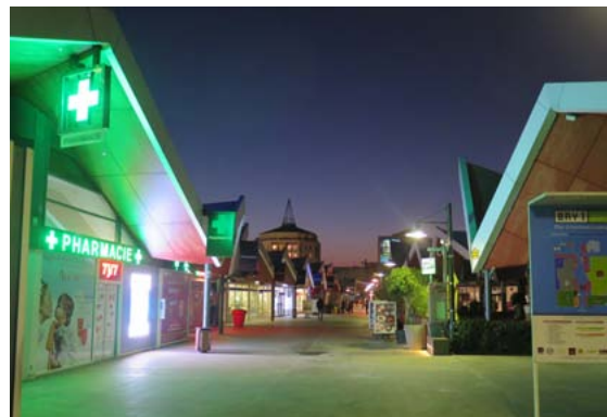
Le centre commercial Bay 2 a ouvert en février en 2003. Bay 1 suivra en 2004.