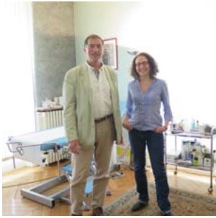
Médecins de l'association des professionnels pour la maison de santé de Marne et Gondoire

Les communes ou groupements de communes ont la possibilité d'attribuer des aides en matière sanitaire notamment pour financer des structures participant à la permanence des soins.