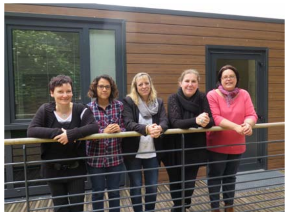
L'équipe du service commun droit des sols

«Si Marne et Gondoire peut permettre aux communes de moins gérer de l'administration, pour se concentrer avant tout sur les habitants, alors nous aurons réussi à développer un deuxième volet de notre action. C'est pour cela que nous avançons sur le projet de service commun Marchés publics comme nous l'avons fait sur l'administration du droit des sols. C'est pour cela que nous agissons pour faciliter la vie des communes.»