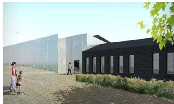
Future maison de santé