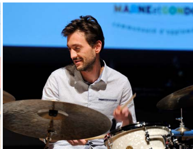
Les enseignants du conservatoire ont lancé la soirée