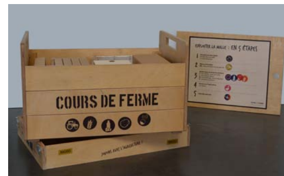
Marne et Gondoire a conçu en 2014 une malle pédagogique sur l'agriculture pour les écoles.