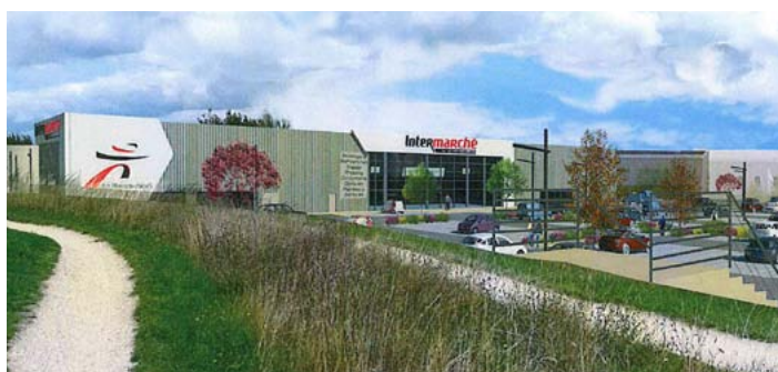
Un centre commercial aux Vallières (p.3)