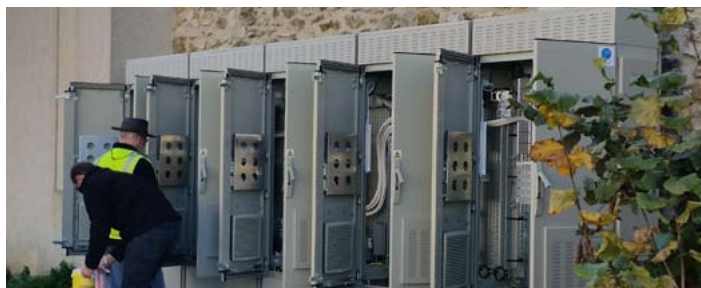
Le point sur la montée en débit (p. 5)