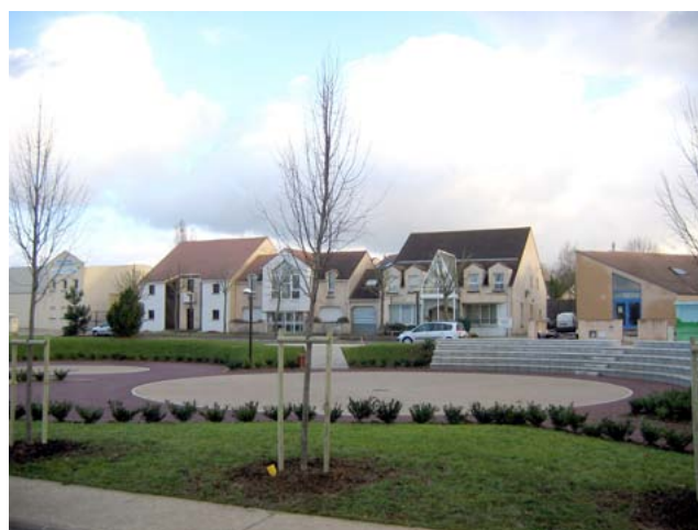
Parc artisanal de Guermantes

Un seul point noir à l'issue de la réunion : le faible débit internet sur Guermantes, un frein considérable pour nos partenaires économiques.»