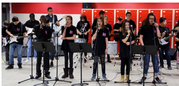
Rock'n'roll au collège de Thorigny (p.2)