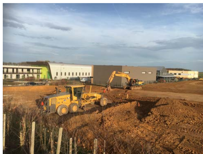
Travaux de terrassement mercredi dernier

Une seconde phase de développement du centre commercial est prévue pour 2018.