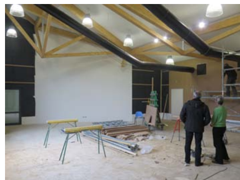
L'intercommunalité a financé les travaux de la partie «musique» de l'extension de la Courée. Ci-dessus, l'auditorium.