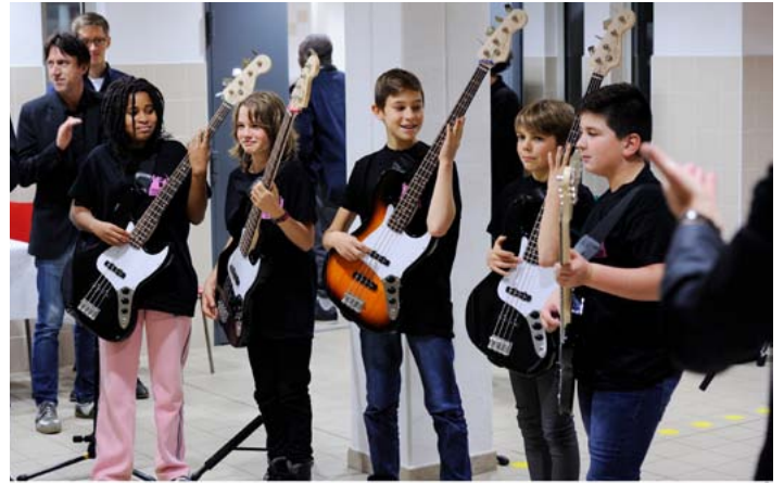
Let's get rocked !

Il s'agit du 3 e orchestre à l'école de Marne et Gondoire : l'orchestre du collège Anne Frank à Bussy-Saint-Georges lancé en 2014 est dédié aux instruments rares et celui du collège Marcel Rivière à Lagny, pionnier en 2012, est un brass band. La fondation Vivendi a financé l'acquisition du parc instrumental des 3 orchestres.