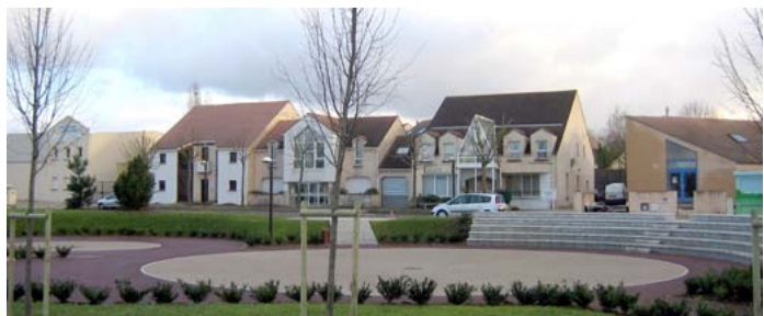
Guermantes reçoit ses entrepreneurs (p. 4)