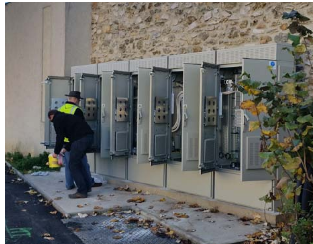
Armoire de montée en débit à Pomponne

La seconde étape sera le déploiement de la fibre optique jusque chez l'habitant en 2020 à Pomponne et Carnetin et en 2022 à Jablines, Lesches, Dampmart, Montévrain, Chanteloup, Conches, Guermantes, Jossigny et Collégien. Les autres communes font l'objet d'engagements des opérateurs privés.