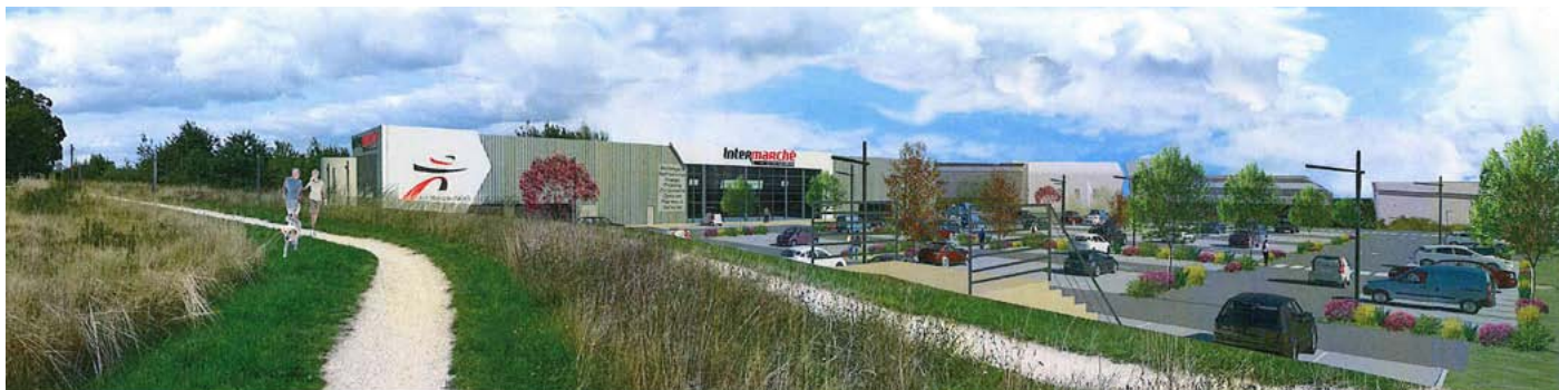
Image de synthèse du futur ensemble

Les travaux du futur Intermarché ont démarré début novembre sur les hauts de Thorigny. Ce nouvel établissement remplacera celui de la rue de Claye, vieillissant et de plus petite taille. Situé dans la zone d'activités des Vallières, l'ensemble comprendra également une station essence et une galerie de petits commerces (pharmacie, pressing, marchand de journaux et sandwicherie notamment). Une belle offre commerciale pour un secteur qui en a besoin. L'ensemble devrait ouvrir fin 2017, début 2018. Marne et Gondoire Aménagement, en charge du développement de la zone, a procédé à la vente du terrain de 28 000 m 2 le 30 septembre dernier.