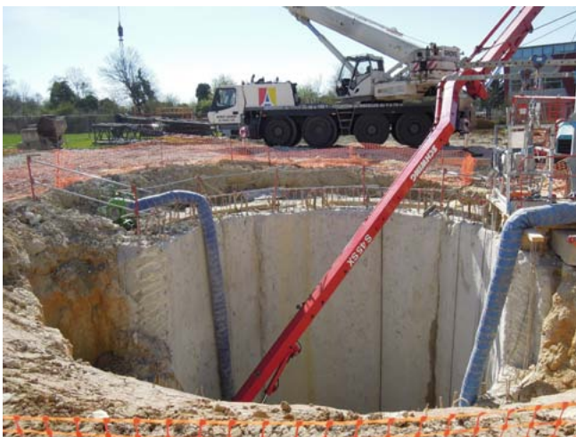
Construction de la fosse de plongée en 2012

Je suis un ancien patineur, de niveau national et sélectionné plusieurs fois en international. J'ai ensuite eu une maîtrise en économie et gestion du sport puis un master management du sport en école de commerce, et cela fait maintenant 15 ans que je suis dans les piscines ! J'ai travaillé à la fois chez des délégataires à Lyon et Nîmes (dont 4 ans à l'UCPA) puis en tant que responsable en régie directe de trois piscines dans une communauté d'agglomération en Charente-Maritime. Depuis juin 2015, je suis donc de retour à l'UCPA en tant que directeur du centre de Marne et Gondoire.