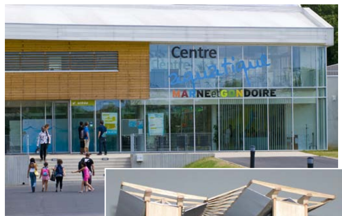
Entrée du centre