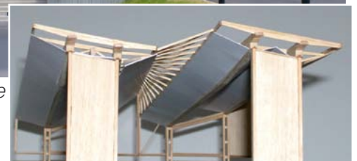
Maquette présentée en 2005