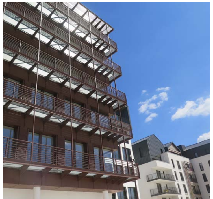
Un bâtiment à basse consommation énergétique

Cet ensemble est situé dans l'écoquartier de Montévrain, pôle en développement de 153 hectares structuré autour du parc du Mont-Evrin.