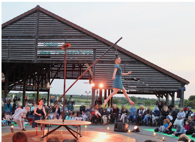
À Chanteloup-en-Brie le jeudi 23 mai