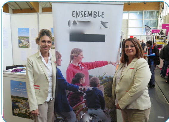
Retour sur le forum de l'emploi à Bussy-Saint-Georges mercredi