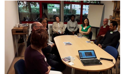
Fête des voisins à l'invitation de la société Servia (insertion) dans la ZAE de l'Esplanade à Saint-Thibault le 6 juin. 17 entreprises étaient présentes.