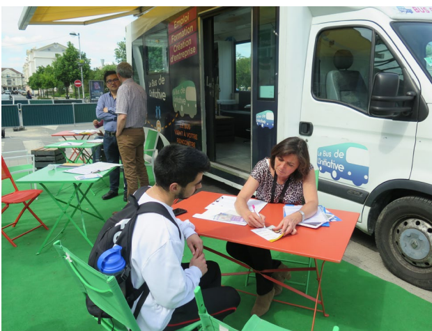
Le bus de l'initiative à Bussy-Saint-Georges le lundi 27 mai. Les passants pouvaient s'informer sur l'emploi, la formation et la création d'entreprise. Le 1 er juin, le bus était au centre commercial du Clos du Chêne. Une opération de Marne et Gondoire avec l'association Créative