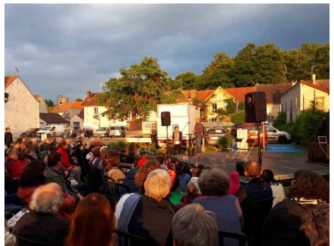
À Lesches le mardi 21 mai. Des spectacles avaient aussi lieu à Collégien, Pomponne et Conches.