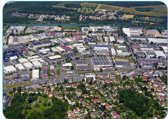
Délibérations du 27 mai