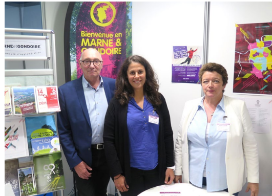
Marne et Gondoire disposait d'un stand à l'entrée du forum