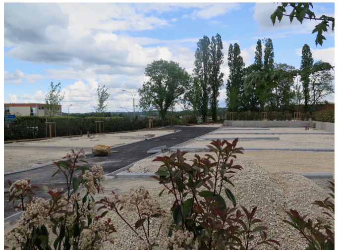
L'aire d'accueil des gens du voyage de Lagny

Une nouvelle aire d'accueil des gens du voyage de 30 places va ouvrir à Lagny-sur-Marne en septembre. Le règlement intérieur des aires est modifié pour la prendre en compte. La tarification et le règlement intérieur des terrains familiaux attenants (10 terrains soit 20 places de 200m 2 ) à cette aire sont également adoptés.