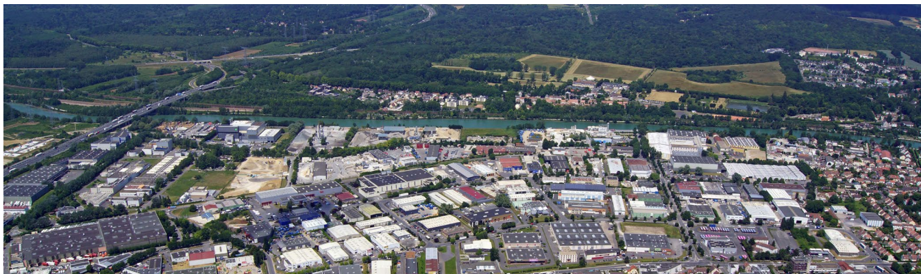
Schéma de cohérence territoriale

Le conseil arrête le projet de SCoT qui va maintenant être envoyé pour avis aux partenaires publics avant l'enquête publique prévue en octobre. Le document, qui sera définitivement approuvé début 2020, remplacera le SCoT actuel, validé en 2013. Il reprend comme orientation majeure, la préservation des espaces naturels, le maintien d'une activité agricole pérenne et souligne la nécessité de valoriser le potentiel énergétique naturel du territoire. La limitation de la consommation d'espace est également réaffirmée avec une plus grande latitude laissée aux communes pour moduler les densités de logements dans leurs différents quartiers. Marne et Gondoire maintient aussi ses engagements de construction de logements pour répondre aux objectifs régionaux mais en prenant davantage en compte la capacité effective du territoire. Les élus inscrivent à ce sujet la nécessité que les projets d'aménagement s'accompagnent d'un renforcement des équipements (au premier rang desquels les collèges et lycées) et des infrastructures de transports.