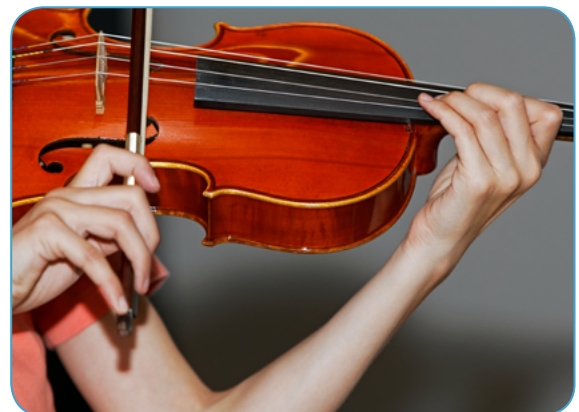
Délibérations du 11 mars