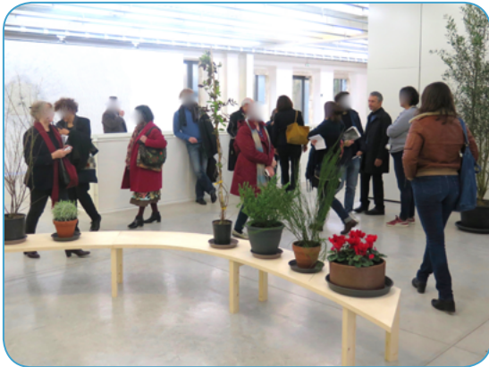
Le Parc culturel ouvre sa saison dimanche à 15 heures