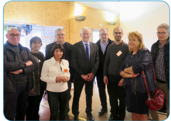
Retour sur le forum de l'emploi mercredi à Lagny