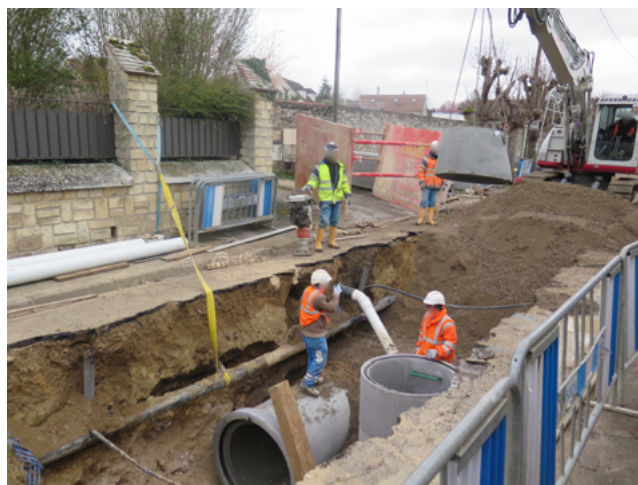
Dampmart, vendredi matin