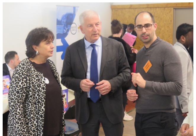
Pôle emploi, Marne et Gondoire et la Mission locale ensemble