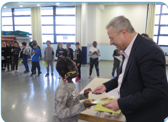
Permis piéton pour des écoliers de Bussy-Saint-Georges